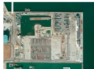
南本牧廃棄物最終処分場

※神明台処分地では、廃棄物の受入や埋立に関する業務（受付審査業務、受入検査、計量・手数料徴収業務、埋立業務、埋立計画の策定及び情報提供業務）は実施しません。